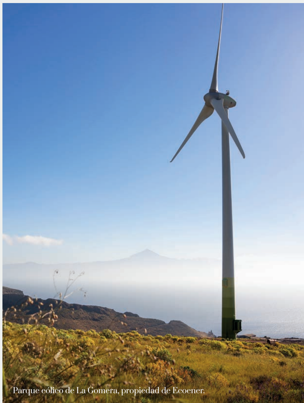
Parque eólico de La Gomera, propiedad de Ecoener.